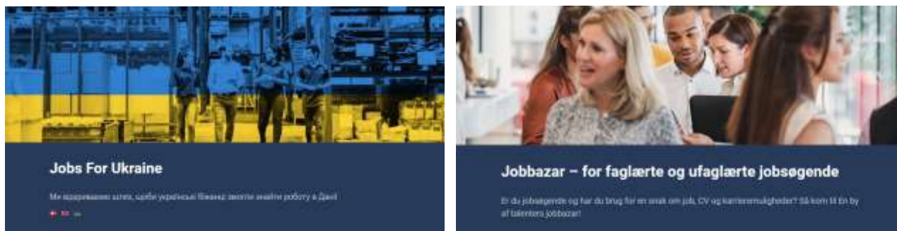
Figur 3: Skærbilleder fra JobsForUkraine.dk og Jobbazaren på Københavns Rådhus den 19. maj

Rusland invaderede Ukraine den 24. februar, og 14 dage senere lancerede vi en ny jobsite med jobannoncer, hvor Ukrainere er velkomne til at søge. Det skabte meget stor opmærksomhed både blandt vores kunder, brugere og hos mediernes, hvor vi 3 gange var i TV for at fortælle om jobsiten. Vi har aldrig før oplevet så stor medieinteresse for en ny facilitet. Dansk Erhverv har flere gange opfordret deres medlemmer til at bruge siden, og vores hashtag #JobsForUkraine bruges generelt af de danske jobsites. Og den 19. maj holder vi Jobbazar på Københavns Rådhus sammen med Jobcenter København, Foreningen Lige Adgang og Powerjobsøgerne for bl.a. ukrainske flygtninge.