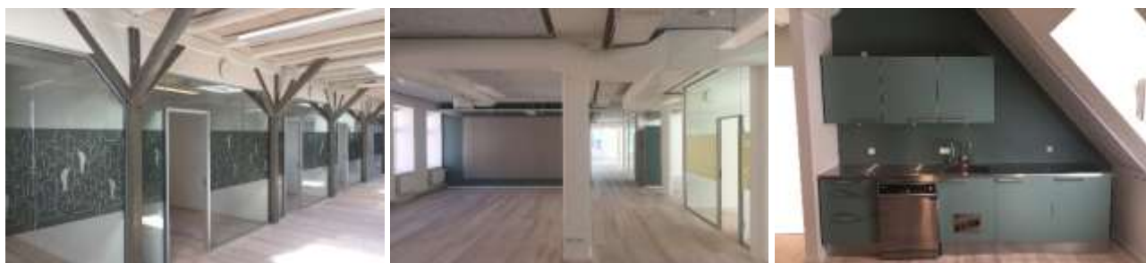
Figur 3: Billeder af de nye lokaler på Carl Jacobsens Vej 29-31 i Valby

I fredags overtog vi de nye lokaler i Valby, hvor vi flytter ind i oktober efter 20 år på Frederiksberg. Aftalen blev indgået sidste år, da vi var ved at vokse ud af de eksisterende lokaler og var usikre på, om vi kunne blive boende på Frederiksberg. De nye lokaler gør det muligt at samle medarbejderne fra Frederiksberg og Islands Brygge på samme adresse, hvilket gør det nemmere at samarbejde på tværs af organisationen. Vi får nogle nyistandsatte og fremtidssikrede kontorlokaler på 7400 m 2 , der ligger tæt på Ny Ellebjerg station, der bliver Københavns tredjestørste togstation, når den nye metrolinje til Sydhavn åbner i 2024. Omkostningerne til flytning, istandsættelse og nye møbler mm. forventes at udgøre 15-20 mio. kr., hvoraf hovedparten bliver aktiveret og afskrevet over 5-10 år. Lejemålet er uopsigeligt i 10 år, og vi forventer at blive boende i de nye lokaler de næste 10-20 år.