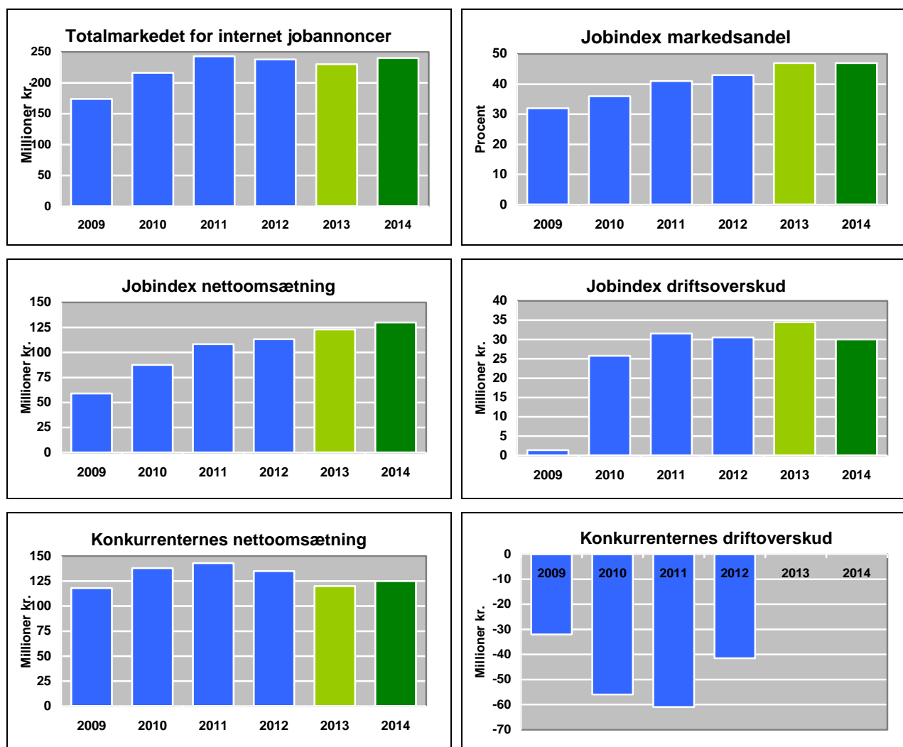
Figur 2: Forventninger til totalmarkedet, markedsandel, nettoomsætning og driftsoverskud i 2014

Vi forventer samtidig en stigning i omkostningerne, dels fordi en del af omsætningsstigningen skal komme fra rekrutteringsprodukter som CV-match og jobannonceskrivning, der er væsentligt mere arbejdsintensive, og derfor har et væsentligt lavere dækningsbidrag end jobannoncer, og dels fordi 2014 bliver et investerings- og integrations-år, hvor vi vil investere i at vinde markedsandele, udvikle nye produkter og øge samarbejdet mellem de forskellige dele af forretningen. Vi forventer på den baggrund et driftsoverskud i Jobindex på knap 30 mio. kr. i 2014 mod 34 mio. kr. i 2013.