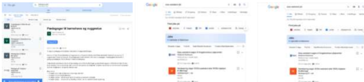
Figur 3: Skærbilleder fra Google for Jobs, der blev lanceret i Danmark i april 2021

Google tabte den 10. november appellsagen om den bøde på 18 mia. kr., som Google har fået for at misbruge sin dominerende stilling i forbindelse med lanceringen af Google Shopping tjenesten. Dommen siger også, at de ændringer, som Google siden har lavet til Google Shopping tjenesten, ikke er tilstrækkelige. Google for Jobs minder efter vores mening meget om Google Shopping, og Jobindex har sammen med 164 andre sites klaget til EU over Google. Det er vores vurdering, at Google Shopping dommen også vil gælde for Google for Jobs. Derudover venter vi på EU's nye Digital Markets Act, som skal sætte rammer for, hvordan tech-giganter må agere på markedet.