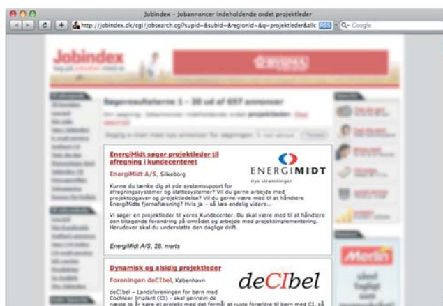
Eksempel på Jobannoncer. Det er kun omsætningen fra optagelse af jobs i databasen (fremhævet) der medregnes.

For kategorien gælder, at jobannoncerne skal være bragt på jobdatabaser rettet mod et dansk publikum.